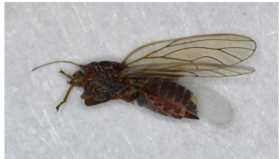
Θηλυκό Cacopsylla pyri