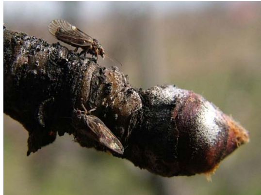
Ακμαία Cacopsylla pyri