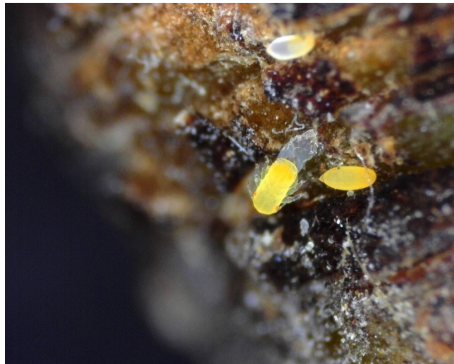
Εκκόλαψη ωού Cacopsylla pyri