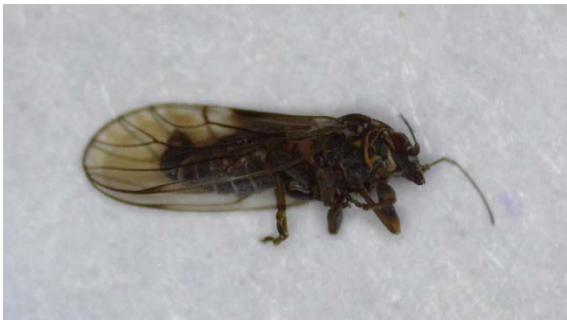
Αρσενικό Cacopsylla pyri